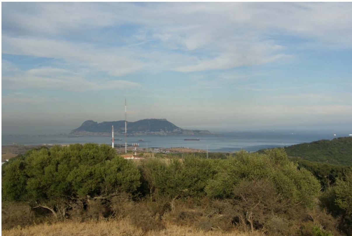
Gibraltar ve dne

Ráno se nepředstavitelný „cancour“ proměňuje stále silněji v monumentální skutečnost. Pomalu se vynořuje z okolní mlhy a my jej poznáváme v celé jeho velikosti. Kdo jej nikdy neviděl, jen těžko pochopí.