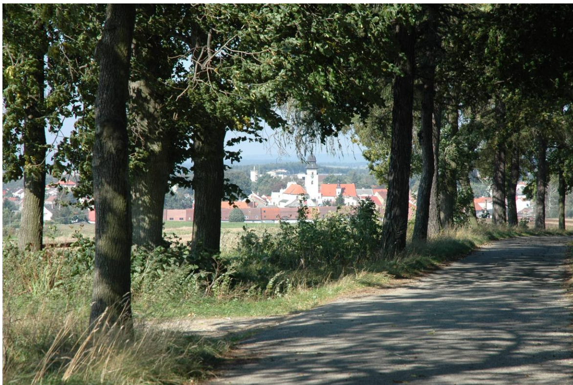
Výhled z modřínové aleje na kostelní věž v Počátkách

Pole byla v 17. a 18. století scelována. Vlivem prostorově stabilizovaných hran pozemků (cesty, příkopy) vedly erozní procesy a technologie orby k vzniku mezí. Teprve v baroku vznikaly louky tak, jak je známe dnes, a diferencovaly se od pastvin. Ryze barokní je obraz rozsáhlých květnatých luk s pravidelným dvousečným obhospodařováním, které sečou řady ženců s kosami. Rozptýlená zeleň ve stromovém patře byla v polní krajině sporadická. Začínají se šířit nové plodiny i okrasné rostliny, především zámořského původu (kukuřice, brambory, rajčata, slunečnice, fazole, jiřiny, tulipány, zimostrázy, jírovce — koňské kaštiny).